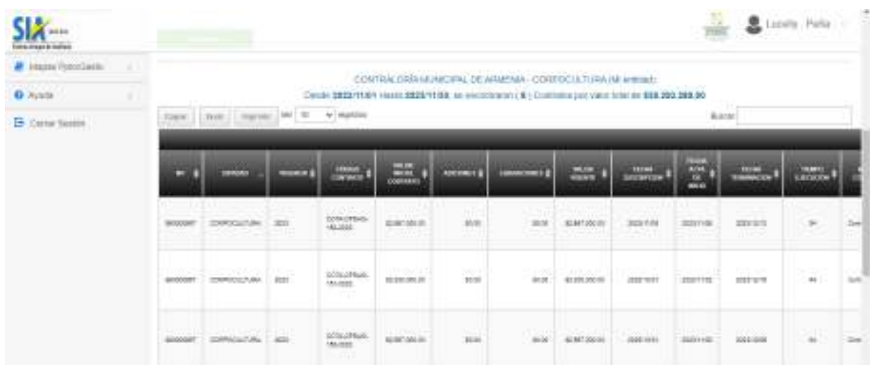
PANTALLAZO SIA OBSERVA NOVIEMBRE

En el mes de noviembre el Sistema Integrado de Auditoría -SIA OBSERVA – fue alimentado con 8 registros por un valor total de $39.293.289.