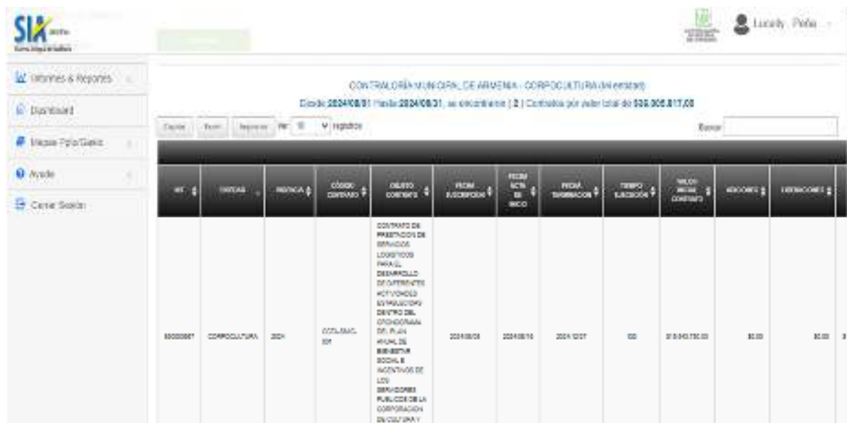
PANTALLAZO SIA OBSERVA AGOSTO

Los contratos de mínima cuantía fueron registrados y rendidos en la plataforma Sia Observa dentro de los términos de ley y con los documentos requeridos por la plataforma como son: el estudio previo y del sector, el certificado de disponibilidad presupuestal, requisitos habilitantes, comité evaluador, invitación, la aceptación de la oferta o contrato, la designación del supervisor, el registro presupuestal, el acta de inicio, las garantías y aprobación de las mismas.